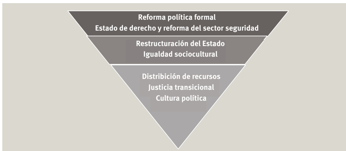
Figura 2. Inclusividad a nivel de resultados: materialización incompleta de los acuerdos políticos.

Los seis casos de país representan dos generaciones de acuerdos políticos de posconflicto (a saber, comienzos de la década de 1990 y mediados de la década de 2000), y por ello han alcanzado etapas muy diferentes de consolidación de la paz y construcción del Estado, o de reforma estatal. Tal como señalábamos en la sección anterior, resulta difícil llevar a cabo una comparación significativa por países de los niveles y el ritmo de materialización de esos nuevos acuerdos políticos, debido al carácter distintivo de los acuerdos vigentes antes del conflicto, la heterogeneidad de las reclamaciones de inclusividad planteadas por los contendientes por el poder y los actores marginados, y las agendas específicas propuestas, negociadas y codificadas por las élites dominantes y nuevas en cada uno de los escenarios. Estas, a su vez, han tenido un impacto sobre la implementación de las reformas (o la carencia de tal implementación), y sobre los grados de inclusividad en las instituciones y sectores del Gobierno.