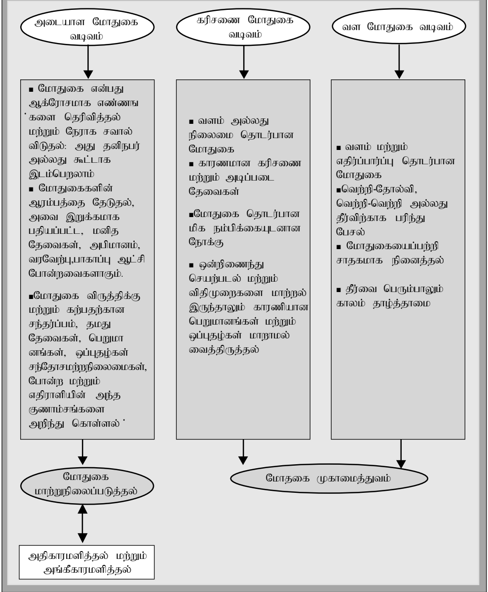
உருவம் 22: அதிகாரமளித்தல் மற்றும் அங்கீகரித்தல் பல்வேறு மோதுகை வடிவம் மற்றும் கற்கைகள் சுட்டிக்காட்டுவது போல்

வெற்றிகரமான மோதுகை இடையீடு, தொடர்பாடலுக்கும், கலந்துரையாடலுக்கும் வாய்ப்புக்களையும், தளங்களையுமே முதலில் உருவாக்கவேண்டும். அதன் பிறகு பரஸ்பர அங்கீகாரம் மற்றும் வலுவூட்டல் என்பவற்றின் செயன்முறைகளை அது வசதிப்படுத்துகின்றது என்பதை அடையாளக் கட்டுக்கோப்பு எமக்கு ஞாபகமுட்டுகின்றது.